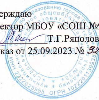
График проведения индивидуальных консультаций по предметам для учащихся, не прошедших государственную итоговую аттестацию по образовательным программам основного общего образования в 2023/2024 учебном году